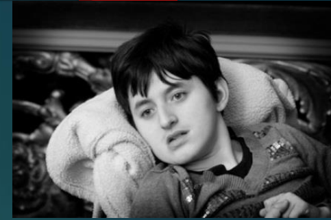
مرضى اشرفى 18

Can it be ethical for a young girl to be treated with hormones so she will remain below normal height and weight , to have her uterus removed and to have surgery on her breasts so they will not develop? Such treatment, applied to a profoundly intellectually disabled girl known only as Ashley born at 1997.