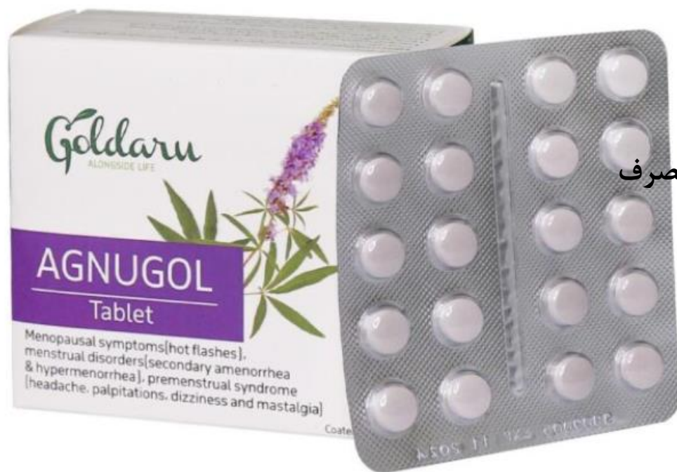
قرص اگنوگل گل دارو

قرص اگنوگل گل دارو در درمان سندرم قبل از قاعدگی (PMS) (سردرد، تپش قلب، سرگیجه، درد پستان)، درمان علائم یائسگی (گرفتگی، تعرق شبانه، افسردگی و ...) و اختلالات قاعدگی موثر است.